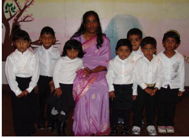
ஆண்டு-1 மாணவர்கள் ஆசிரியருடன்