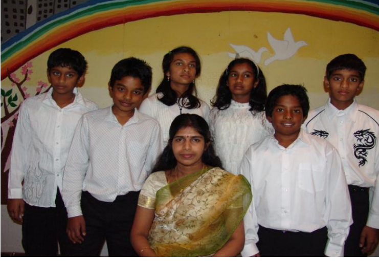
ஆண்டு-7 மாணவர்கள் ஆசிரியருடன்