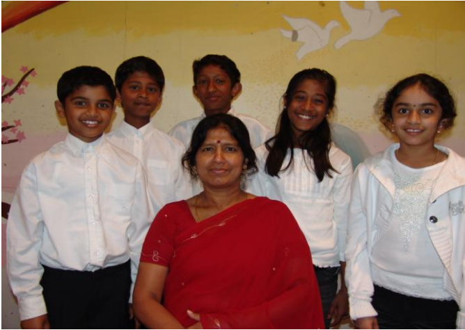
ஆண்டு-6 மாணவர்கள் ஆசிரியருடன்