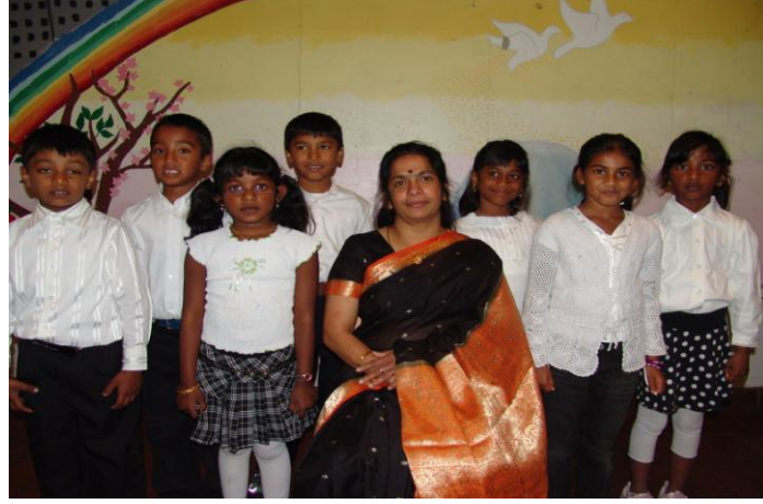
ஆண்டு-2 மாணவர்கள் ஆசிரியருடன்