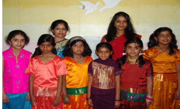
சங்கீத மாணவர்கள் ஆசிரியருடன்