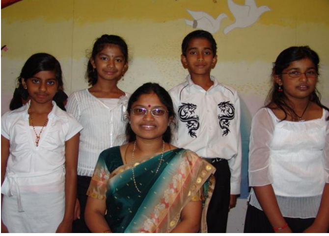
ஆண்டு-5 மாணவர்கள் அதிபருடன்