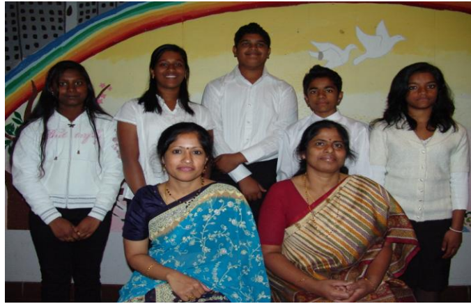
ஆண்டு-8,9 மாணவர்கள் ஆசிரியர்களுடன்