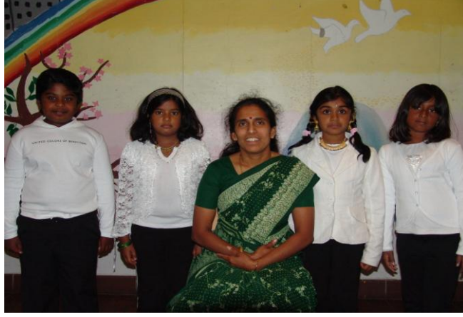
ஆண்டு-3 மாணவர்கள் ஆசிரியருடன்