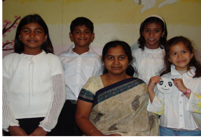
ஆண்டு-4 மாணவர்கள் ஆசிரியருடன்